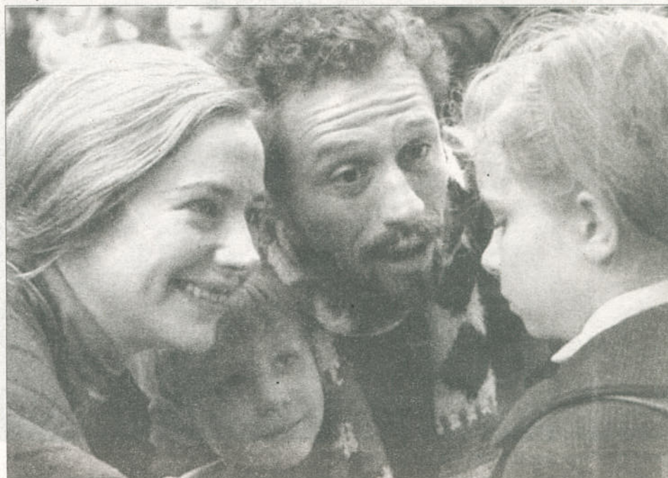
Julie Depardieu fait partie des invités. C'est l'héroïne de « La Faute à Fidel » qui est en compétition.

« On préfère les offrir, les faire gagner. Nos moyens restant limités, vu le jeune âge de notre festival, nous ne pouvons pas investir dans les frais coûteux d'une billetterie. Et nous avons préféré pour cette deuxième édition choisir une salle de 300 places pour qu'elle soit remplie plutôt qu'une salle trois fois plus grande qui reste à moitié vide, comme l'an dernier ».