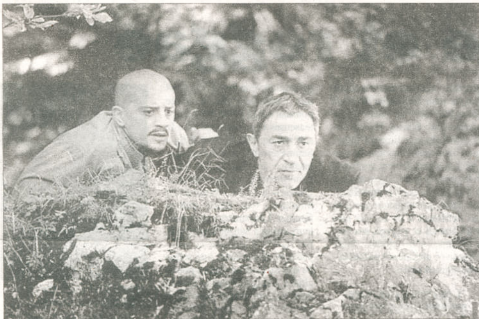
Saïd Taghmaoui (ici avec Richard Berry dans le film « Entre chien et loup ») fait partie des jurés de ce festival.