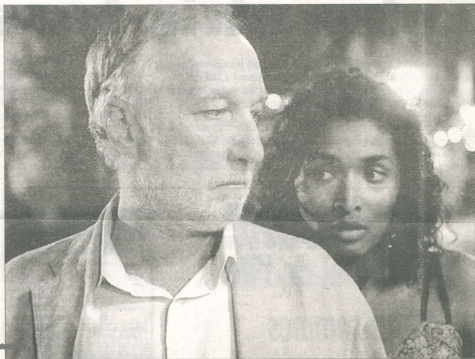
François Berléand (ici dans « Fragiles ») un acteur qui crève l'écran de plus en plus souvent