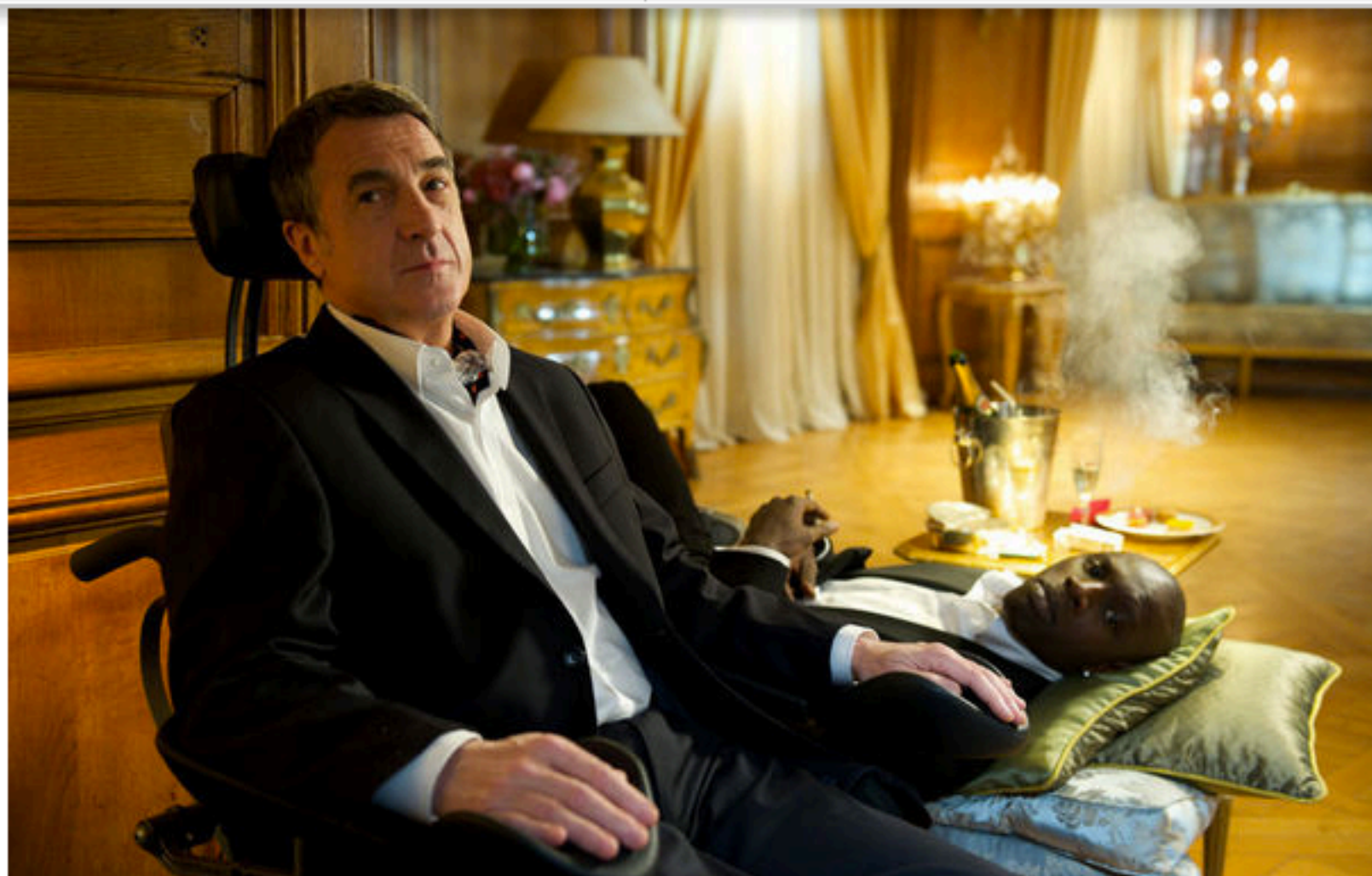
François Cluzet et Omar Sy, héros sans pitié de Intouchables.