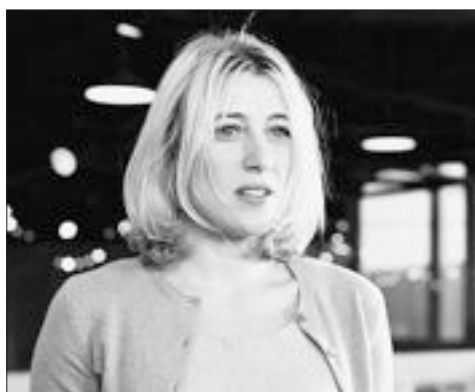
Valeria Bruni Tedeschi vient présenter son second film, "Actrice", dont elle est précisément l'une des... actrices