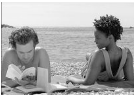
Aïssa Maïga, ici avec Romain Duris dans le film de Raphaël Fejtö "L'âge d'homme... maintenant ou jamais", accompagnera le réalisateur au festival.

* Le jury sera présidé par Claude Miller, entouré de Julie Depardieu, Ludivine Sagnier, Aure Atika et Alysson Paradis, qui devraient être rejoints par une personnalité dont le nom reste encore un mystère.