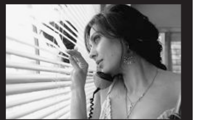
"Caramel", film sorti en août, est le premier film de Nadine Labaki. Il a déjà fait fondre ses premiers spectateurs. La réalisatrice interprète aussi le premier rôle.

Le Festival du Film de la Réunion avec la complicité du Journal de l'Île , Clicanoo TV, RFO, Cadbury et le rectorat, organisent un concours vidéo de court-métrage, Public scolaire et universitaire concerné de 12 à 25 ans en solo ou en groupe, tous amateurs, individu ou association, présenté par son établissement. Thème choisi, la sauvegarde du patrimoine réunionnais, traitée en vidéo, n'excédant pas 3 minutes générique compris. Le court-métrage doit être envoyé par internet, accompagné de sa fiche d'inscription, à www.clicanoo.tv . Il sera mis en ligne sur le site clicanoo immédiatement pour le vote du public. Prévoir et garder une copie de haute qualité sur DVD de bonne définition, demandée, si primée, par les organisateurs du festival, pour projection sur grand écran. Six prix seront décernés par un jury différent de celui du long-métrage le 26 octobre. Tous les détails sur clicanoo tv.